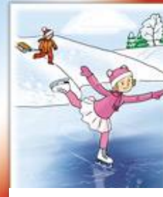
Никогда не катайся на коньках на водоеме