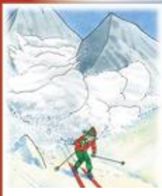
Не катайся на лыжах в горах в одиночку