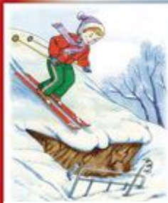
Не спускайся на лыжах в незнакомом месте