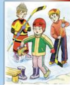
Не берись на морозе голыми руками за металлические предмет