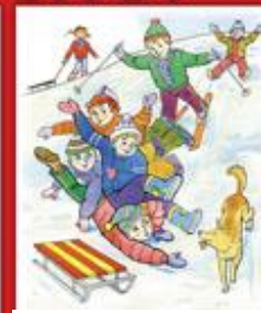
Не катайтесь на санках с горки «кучей малой»