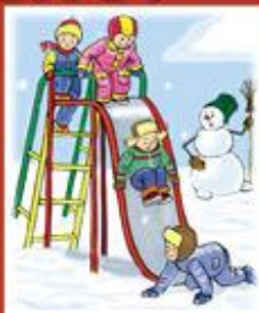
Скатившись с горки, сразу поднимайся и уходи