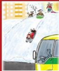
Не спускайся на санках вблизи проезжей части дороги