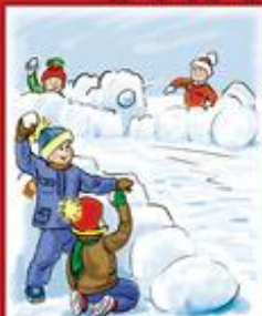
Не бросай снежки в лица играющих во время игр