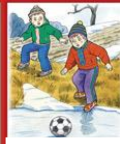
Не заходи на тонкий лед, играя в подвижные игры