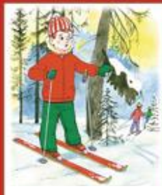
Не отставай от взрослых, катаясь на лыжах в лесу.