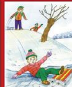
Не катайся с горки рядом с водоемом